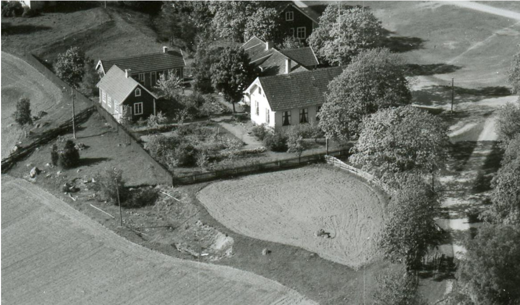
Skolhuset på flygfotografi (okänt årtal). Då fanns två uthus på tomten, samt en anlagd trädgård. Ytan söder om skolan var en åker.