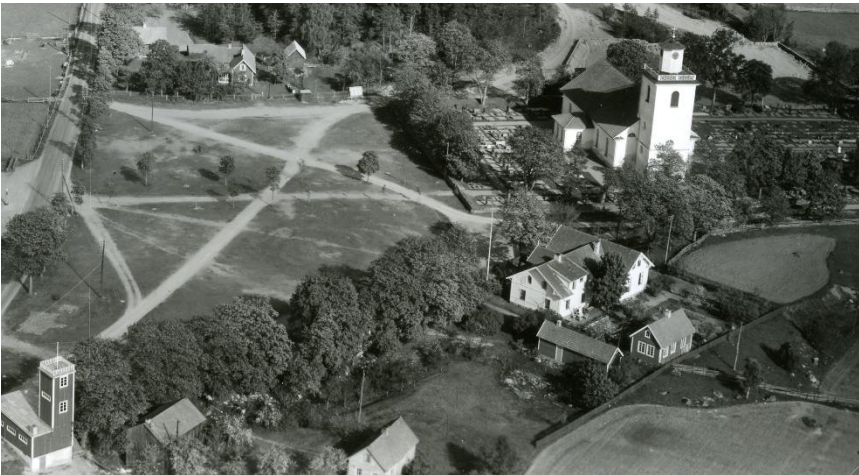
Bilden visar skolans centrala plats i sockencentrumet, mellan kyrkan, brandstationen och marknadsplassen. Allén utmed Marknadsvägen syns också tidigt.