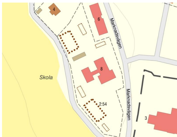
Förslag möjliga placeringar av nya byggnader (rödbruna streckade rutor) på tomten. SJ, 2025

Bruna streckade linjer markerar förslag på möjliga nya byggrätter. Stora rutor = Max höjd samma som skolan. Små rutor = Max bygghöjd samma som äldre, befintligt uthus.