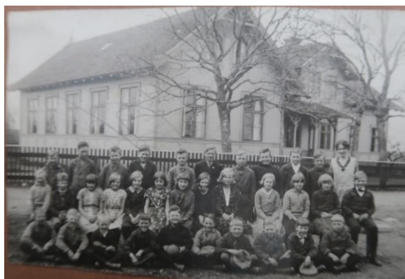
Skolan vid slutet av 1920-talet. Bilden visar att fönstren då var mörkare och att listerna hade en mörkare kulör än fasadfärgen.

Folkskolestadgan kom 1842, en lag om att alla svenska barn skulle gå i skola. Den första fasta skolan i Bäckebo byggdes sex år senare, 1848. Denna, som kallades kyrkskolan, ska enligt uppgift ha rivits när den nuvarande större skolan byggdes på samma plats 1905 (Skulle det kunna vara så att delar av den gamla skolbyggnaden finns kvar som en del av den nya?). Den nya skolan byggdes med två stora skolsalar och två bostadslägenheter för lärare. Skolsalarna byggdes med högt i tak och luftig interiör. I två uthus på gården låg utedass, vedförråd med mera.