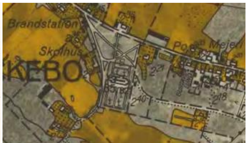
Karta från 1941, som visar de viktiga institutionerna i sockencentrumet då: kyrkan, skolhuset, brandstationen, post och