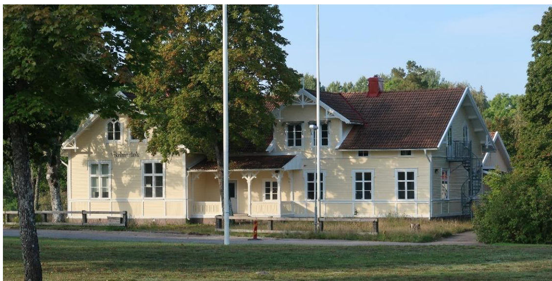
Bild från 2020. Det på 1970-talet tillbyggda skolköket skymtar i bakgrunden.