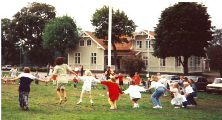
Barn dansar inom området för den gamla marknadsplatsen, med Bäckeboskola i bakgrunden.

Invändigt finns två stora skolsalar med högt i tak bevarade. Äldre spegeldörrar i trä finns kvar på vissa ställen, och de två lärarbostäderna är fortfarande intakta med kakelugn och tidstypiska 1950-talskök. Vinden är till stor del orörd med öppna takstolar och synligt undertak. Vid varje gavel finns ett mindre "bostadsrum" och vid ingången finns små träförråd. Originalfönster från 1905 finns kvar vid vindsgavlarna.