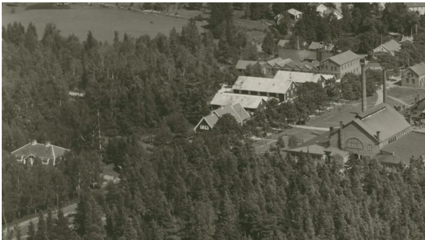
De båda "villorna" 1935.