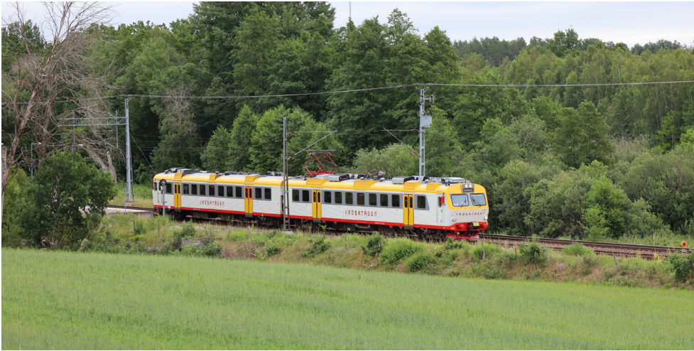
Bild 3. Krösätåget på kust- till kustbanan.