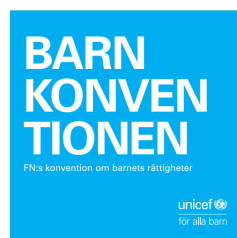
Figur 2. Barnkonventionen