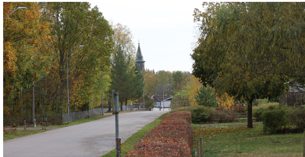
Bild 1. Vy från korsningen Brödravägen/Centralvägen med Örsjökyrkans torn i blickfång.

En annan viktig aspekt är prioriteringar av färdmedel och belysning, men också synbarhet och överblickbarhet som påverkar den upplevda tryggheten. Skadegörelse, skräp och ödehus är något som drar ner den upplevda tryggheten.