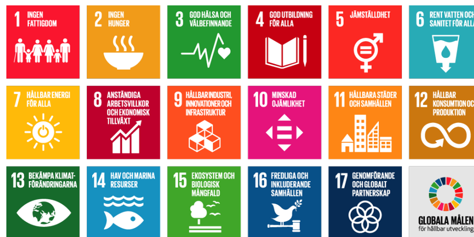
Figur 3. Definitioner av FN:s 17 globala mål.