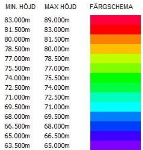
Figur 1: Höjddataanalys före exploatering.