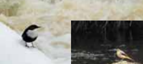
Strömstare (Cinclus cinclus)