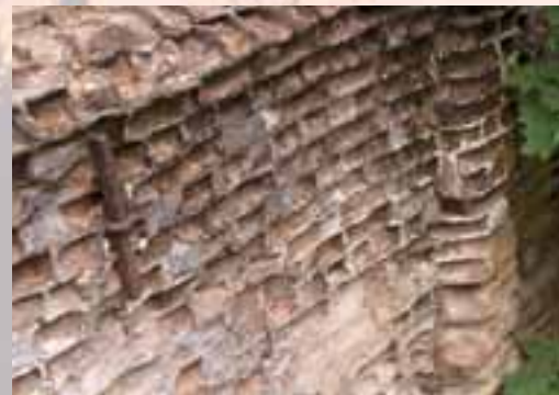
Murade rester efter Svartbäcksmålas kvarn och såg