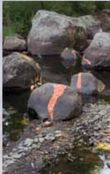
Glaskonst i S:t Sigfridsån vid Pukeberg